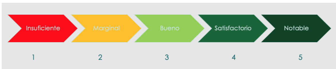
Figura 2 Escala de valoración del desempeño