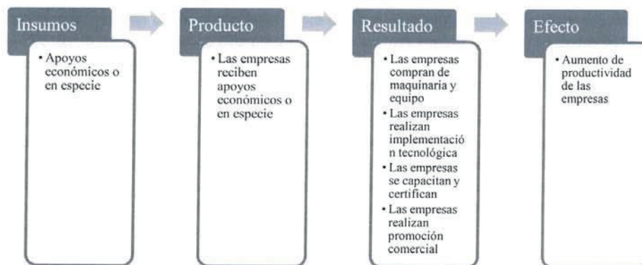
Diagrama de lógica de la intervención