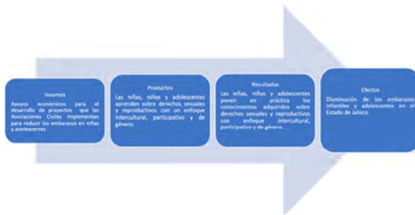
Ilustración 1. Lógica de intervención

La lógica de intervención es la que a continuación se señala.