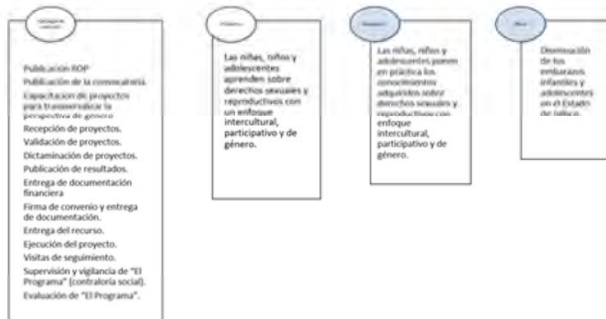
Ilustración 2. Esquema de intervención.