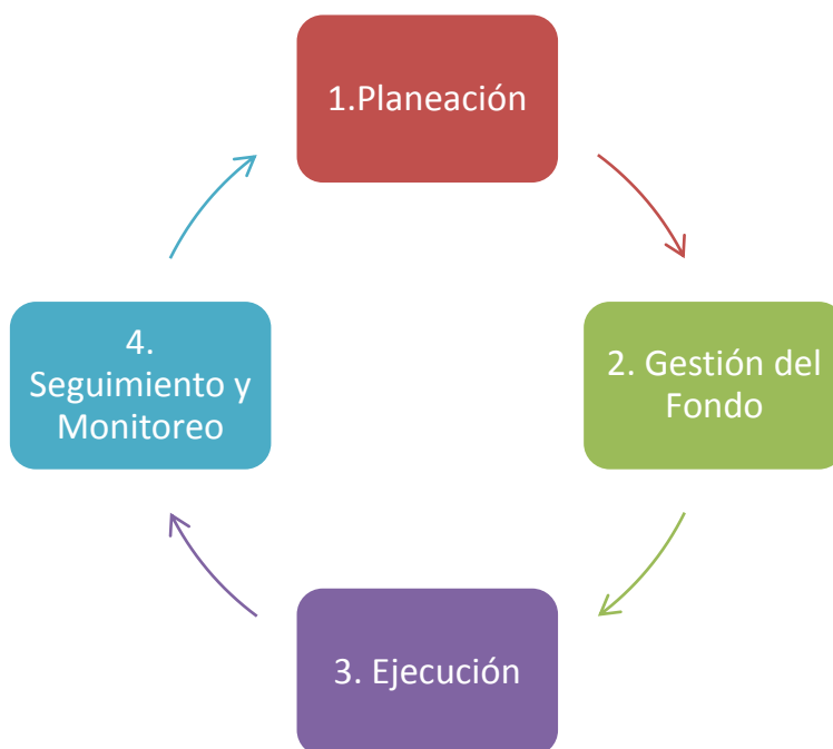
Figura 2. Modelo General de Procesos del Fondo Metropolitano

En la descripción y análisis de cada uno de los procesos, se deben contestar las preguntas de investigación con base en la metodología planteada en la sección 3, incluyendo la escala de Likert, cuando aplique una valoración cuantitativa.